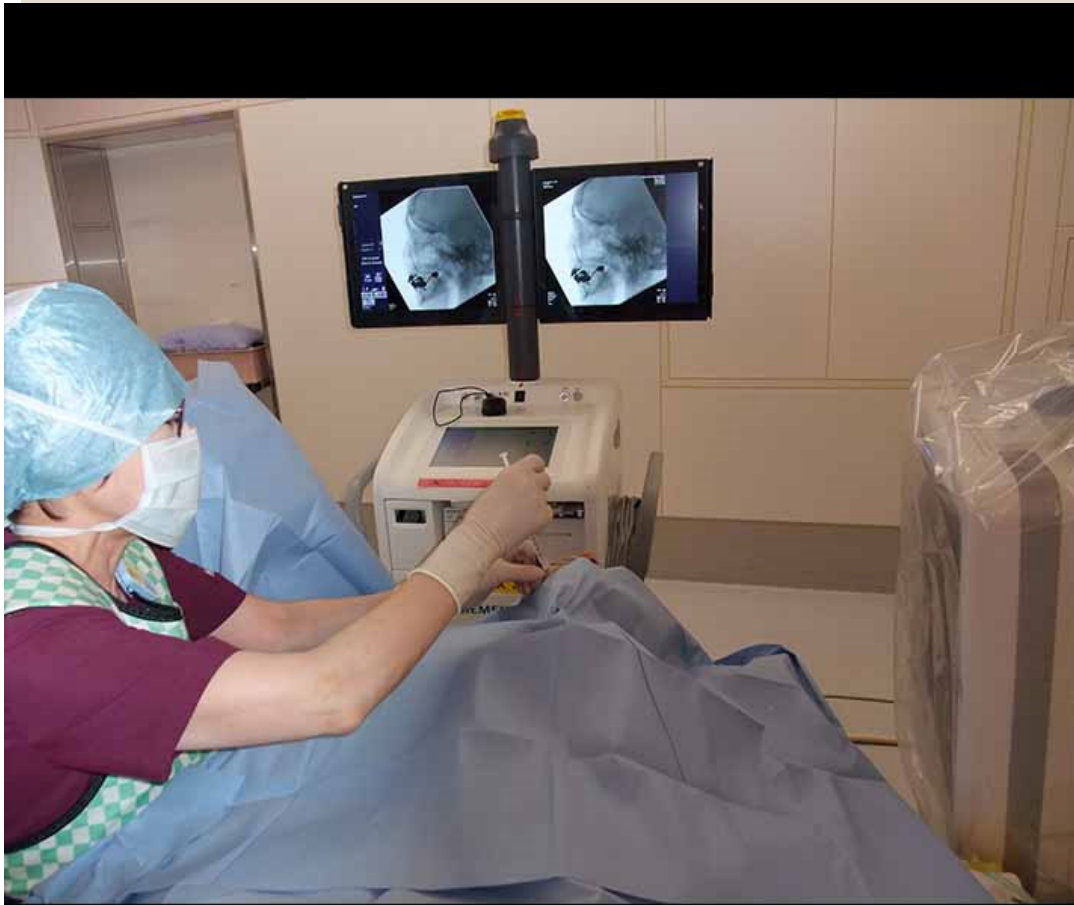
ガッセル神経節ブロック