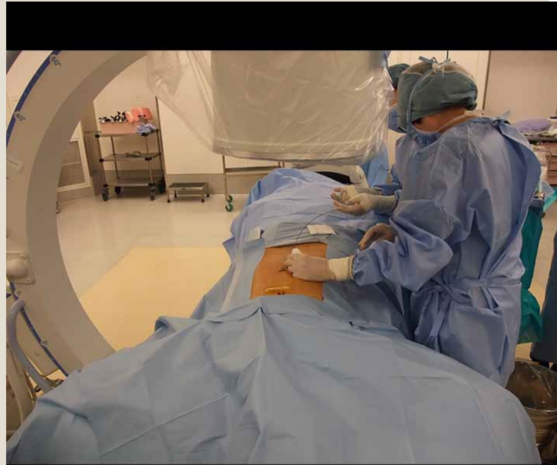
脊髄刺激電極挿入術